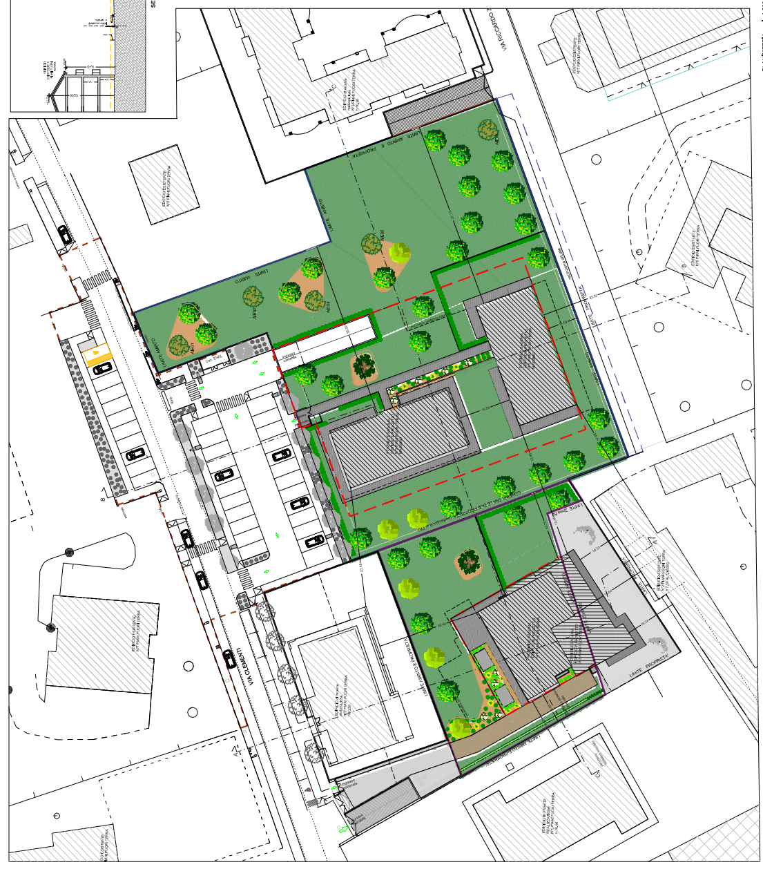
PLANIMETRIA scab. 1:200