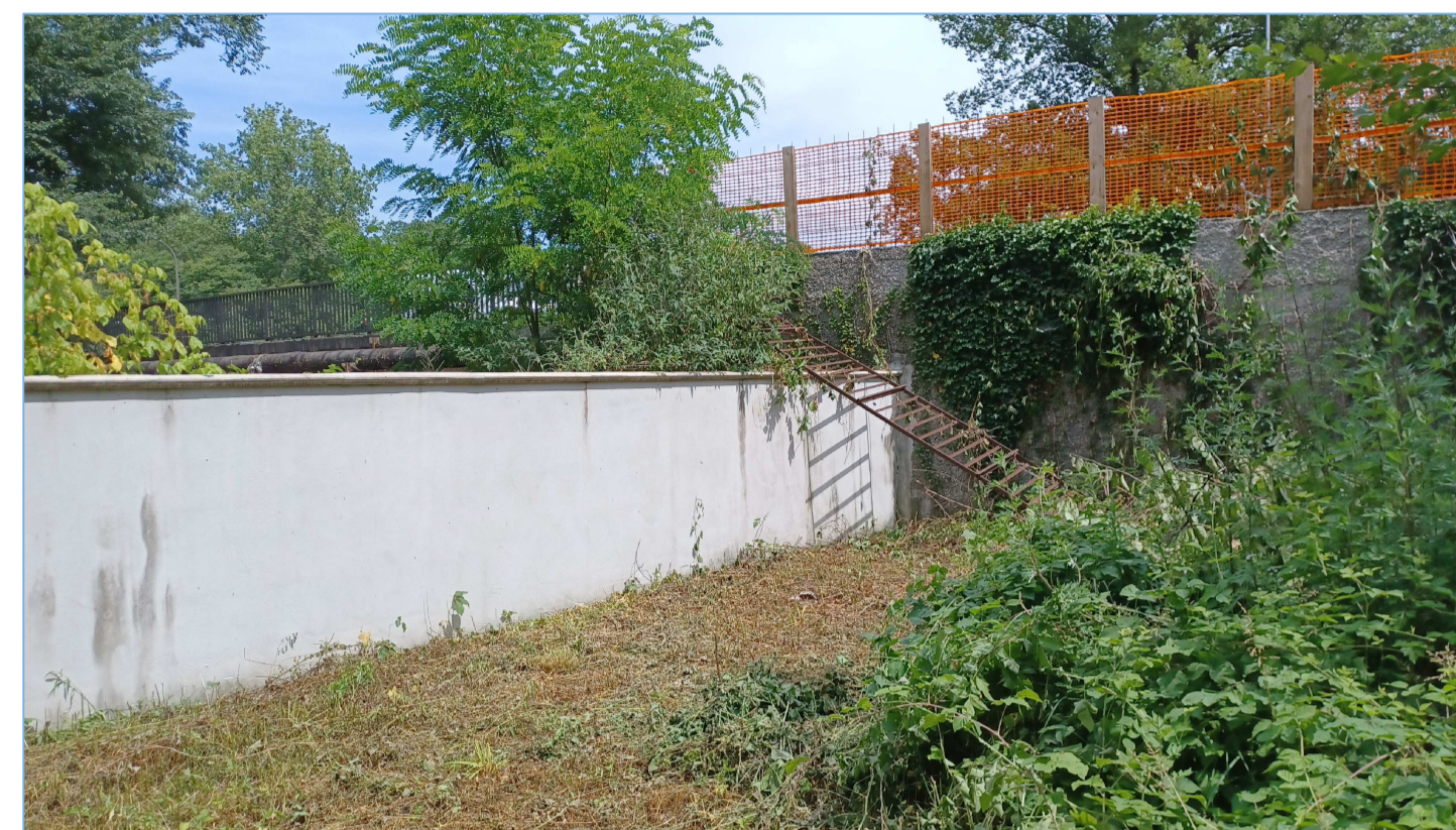
CONFINE SUD EST