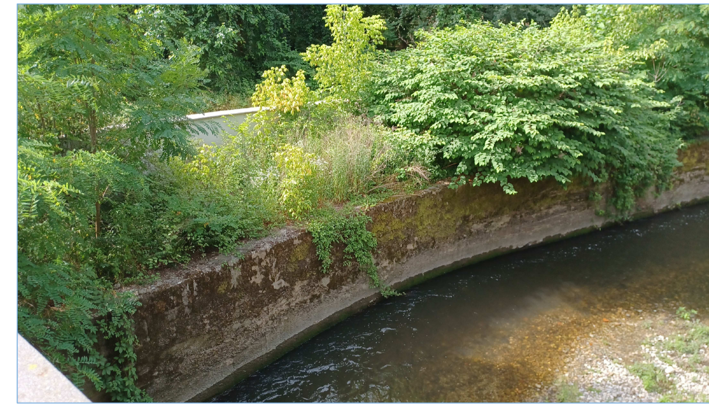
ARGINI E FASCIA DI MANUTENZIONE