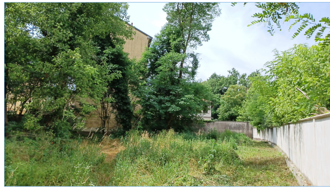
CONFINE SUD OVEST