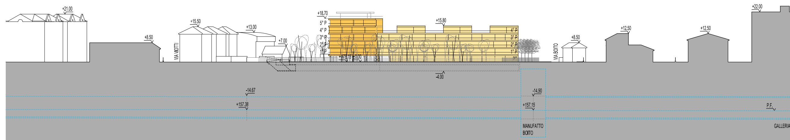
2. PROFILI ALTIMETRICI SUD LUNGO VIA CARISSIMI