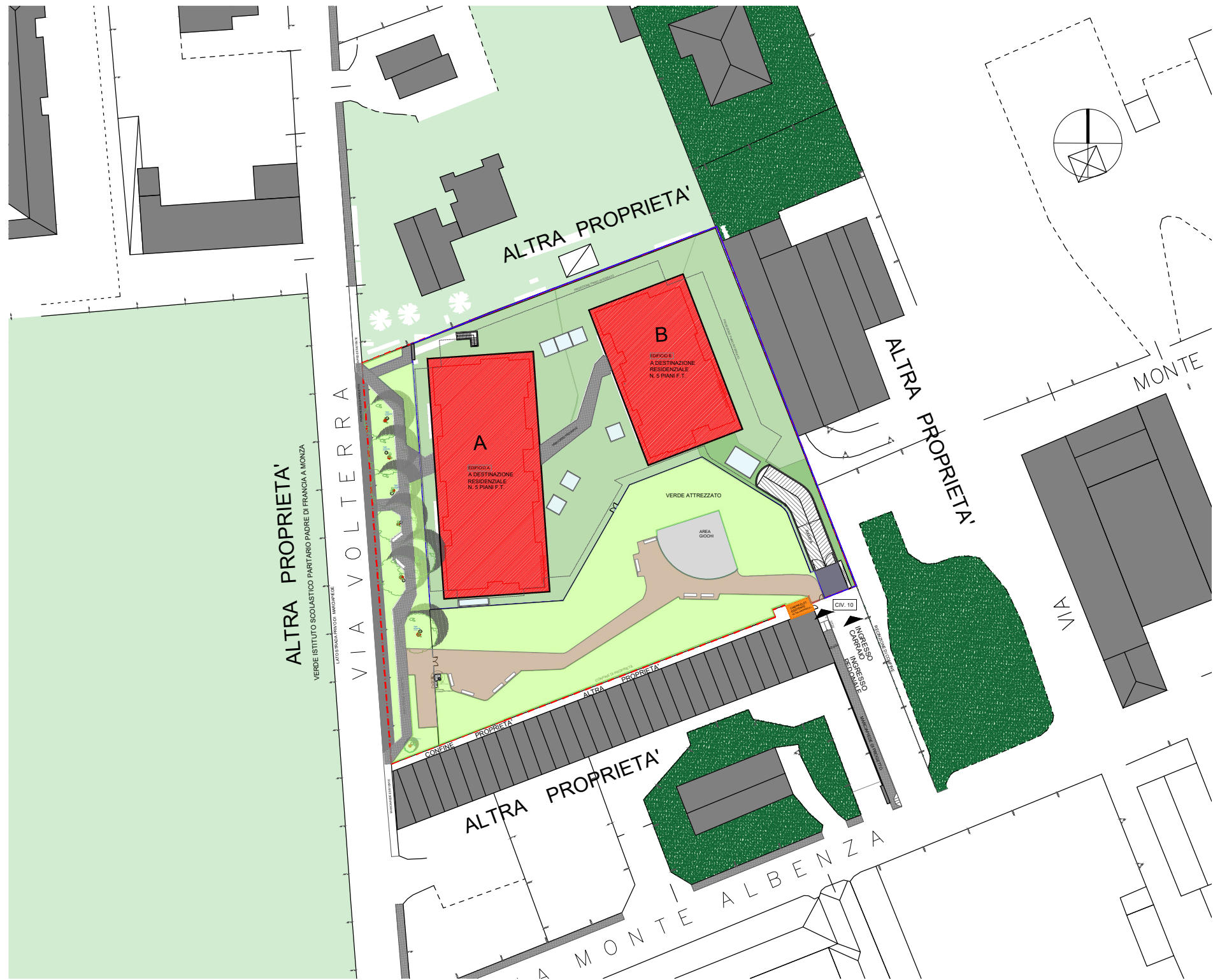
K-PLAN STATO DI PROGETTO SCALA 1:1000