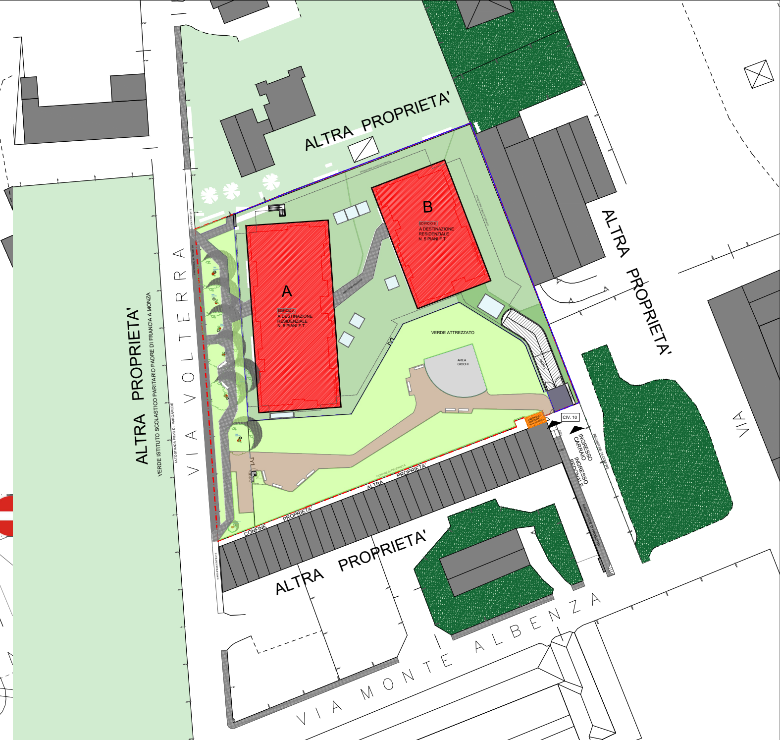
K-PLAN STATO DI PROGETTO (PR), SCALA 1:1000

ALTRA PROPRIETA' VERDE ISTITUTO SCOLASTICO PARTARIO PADRE DI FRANCA A MONZA